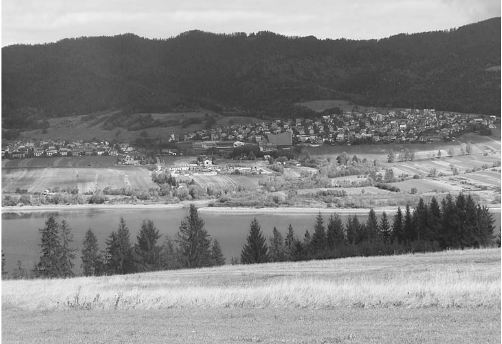
Fot. 3. Widok na wieś Maniowy, 2007 r. The view towards the village of Maniowy, 2007.

niezwykle silny dysonans w krajobrazie tej części Podhala. Jest to spowodowane stokowym rozłożeniem struktury osadniczej, nie nawiązującej do linearnych, łańcuchowych układów wsi górskich doskonale wpasowanych w naturalną rzeźbę terenu. W ogólności – odejście od wzorców kulturowych tworzących czytelny i wartościowy model kształtowania form architektonicznych i ich zespołów. Obserwujemy tutaj wprowadzenie obcych wzorców zabudowy, degradujących dotychczasowe tradycyjne (Fot. 4). Jest to całkowita utrata tożsamości wsi w relacji nie tylko do starych Maniów, ale w skali całego Podhala.