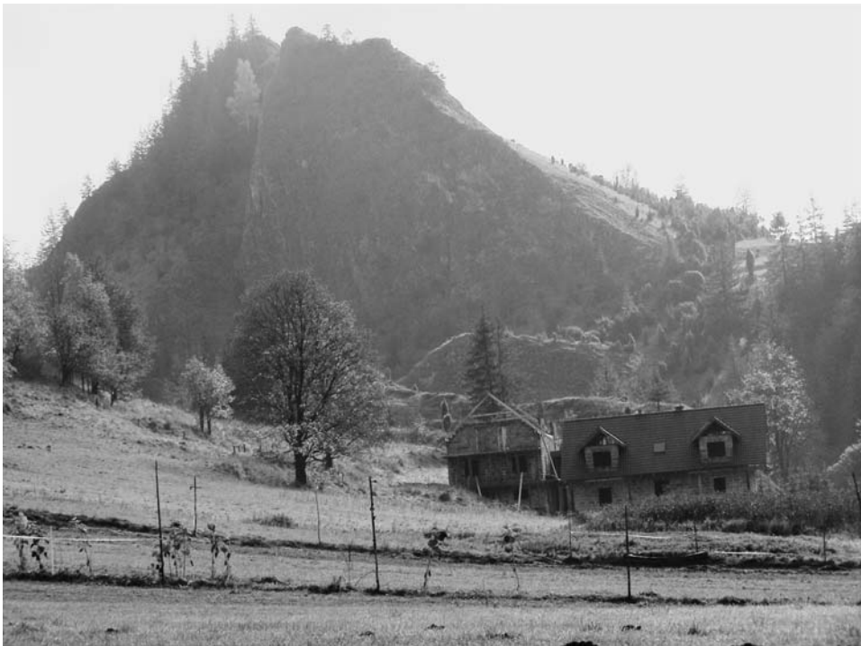
Fot. 1. Dom przy granicy rezerwatu przyrody „Biała Woda” w Jaworkach.

W sąsiedztwie jest więcej przykładów nie respektowania zarówno prawa budowlanego jak i ochrony krajobrazu doliny Białej Wody. Wchodzenie wysoko ponad dolinę z nową zabudową na najbardziej eksponowane krajobrazowo stoki Ruskiego Wierchu działa destrukcyjnie na sam układ przestrzenny wsi Jaworki, tworzącej w tym