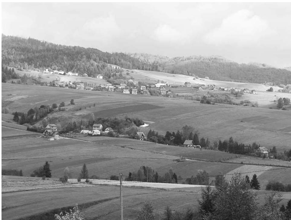
Fot. 2. Obszar pomiędzy Grywałdem a Krośnicą. The view towards a large area between Grywałd and Krośnica villages.

fragmentcie rodzaj śródgórskiego wnętrza krajobrazowego. Zabudowa ta jest realizowana z naruszeniem prawa budowlanego i przestrzennego.